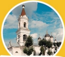
Церковь Троицы Живоначальной, что за Тьмакой, «Белая Троица» ул. Троицкая, 38

сооружен древнейший из сохранившихся храмов Твери. Здесь сохранились иконостас XVIII в., настенная живопись конца XVIII – начала XIX вв., несколько древних икон, старинные предметы богослужения.