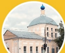
Церковь Рождества Пресвятой Богородицы в Ямской слободе ул. Вагжанова, 47

Михаила Ярославича, привезенные из Москвы, жители города встречали в Церкви Рождества Пресвятой Богородицы. Это один из немногих храмов в Твери построенный в стиле классицизма. Здание отличается необычной объемно-пространственной композицией храма и декором фасадов.