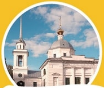
Церковь Воскресения Христова (Трех Исповедников) наб. Афанасия Никитина, 38

был причастен к строительству церкви. Здесь устроен придел в честь святых православных мучеников – Гурия, Самсона и Авива. В Воскресенской церкви в настоящее время находится новонаписанная чтимая Икона Божией Матери «Взыскание погибших».