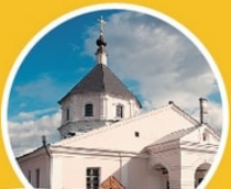
Церковь Покрова Богородицы наб. реки Тьмаки, 1

на полуострове расположен освященный в 1774 г. Покровский храм. Гармоничным дополнением к храму служит ограда с четырьмя псевдоготическими башнями на углах, Святыми воротами и сторожкой.