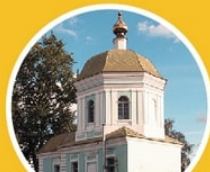
Церковь Миня, Виктора и Викентия ул. Кропоткина, 62/1

деревянной церкви новый храм возводился с 1784 по 1809 гг.