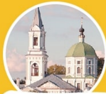
Храм Великомученицы Екатерины ул. Кропоткина, 19/2

на строительство храма в Затверечье пожертвовала императрица Екатерина II, остальные средства собрали прихожане. Храм выполнен в стиле барокко с пристройками в форме классицизма.