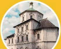
Церковь Бориса и Глеба Краснофлотская набережная, 5

на правом берегу Волги, на средства прихожан была сооружена в 1759–1771 гг. церковь Бориса и Глеба. В архитектуре здания ярко выражены элементы «нарышкинского» стиля.