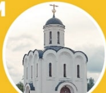
Церковь Михаила Тверского Краснофлотская набережная, 1

сооружена церковь в честь Святоблагочерного князя Михаила Тверского по проекту тверских архитекторов В. Курочкина и А. Барковского в 2002 г. Храм строили «всем миром».