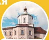
Успенская церковь наб. Афанасия Никитина, 1

уцелевшая постройка Отроч монастыря, основанного в 1265 г. при князе Ярославле Ярославиче – Успенская церковь (построена в 1722 г.). Искусствоведы обнаружили на стенах храма роспись середины XVIII века.