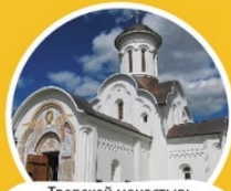
Тверской монастырь Савватьева пустынь Калининский р-н, д. Савватьево

савватьевских храмов связано с исцелениями от различных болезней по молитвам преподобному Савватию (около 1390 г.). Знаменитую своим целебным свойством савватьевскую воду верующие набирают из источника на берегу р. Орша.