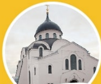
Христорождественский женский монастырь ул. Баррикадная, 1-1а

относится первое письменное упоминание о монастыре. Сохранились и восстанавливаются Воскресенский кафедральный собор, собор Рождества Христова, Спасская надвратная церковь, Троицкая церковь.