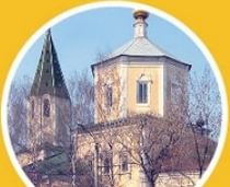
Церковь Троицы Живоначальной, что за Волгой. ул. Шевченко, 1

поддержали голодающих, предоставив им работу на строительстве церкви. Храм в традициях московского «нарышкинского» зодчества был освящен в 1737 г.