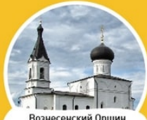
Вознесенский Оршин женский монастырь Калининский пер., 46

был основан Оршин монастырь – один из самых древних на Тверской земле, с каменным храмом Вознесения Господня 2-й пол. XVI в. Первоначально монастырь был мужским. Сейчас на территории находится приют, в котором воспитываются девочки от 1,5 до 17 лет.