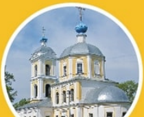
Церковь Иоанна Предтечи Беляковский пер., 46

барочных храмов Твери. В середине 1970-х частично отреставрирован.